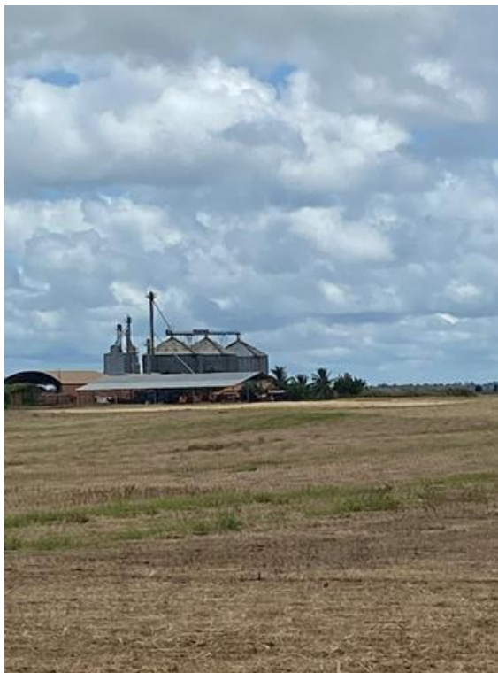
Figura 5 – Painéis fotovoltaicos (em frente aos silos) em propriedade rural.

-mista: rede distribuidora e geração própria. Uma propriedade (a de número 14 na Tabela 1) usa tanto energia fornecida por empresa (rede distribuidora) como também energia gerada localmente (no caso, energia solar).