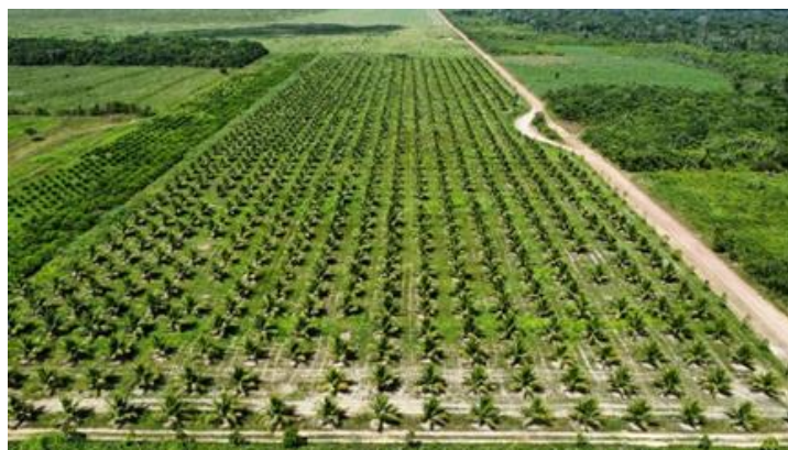
Figura 3 – Agricultura nas propriedades estudadas.