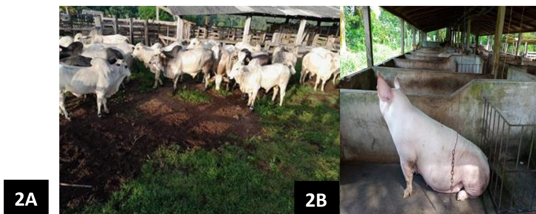
Figura 2A (esquerda) – criação de gado. Figura 2B (direita) – criação de suínos.

Todas têm o CAR (Cadastro Ambiental Rural), com exceção de duas.