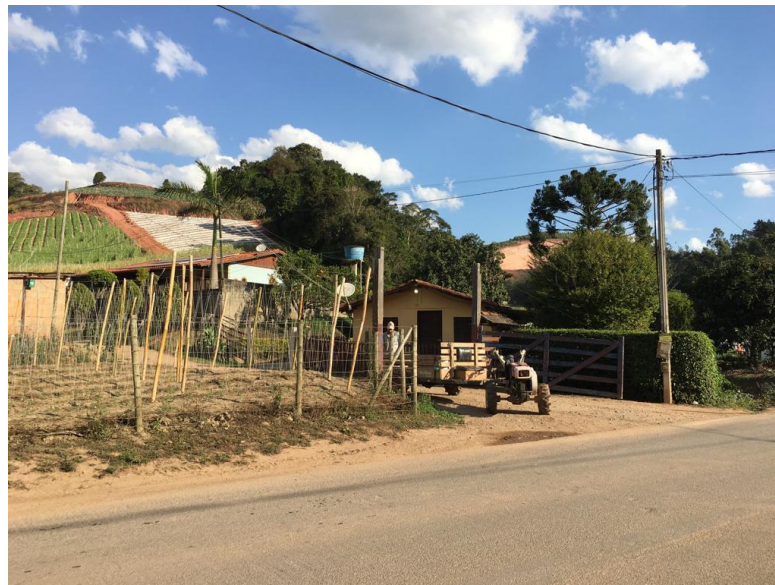
Figura 4 – Fotografia mostrando a rede de distribuição (postes) na área rural estudada.

Em todas as propriedades há o acesso à rede de distribuição de energia elétrica. Destas, seis recebem energia da concessionária Energiza e três da concessionária Enel (Figura 4).