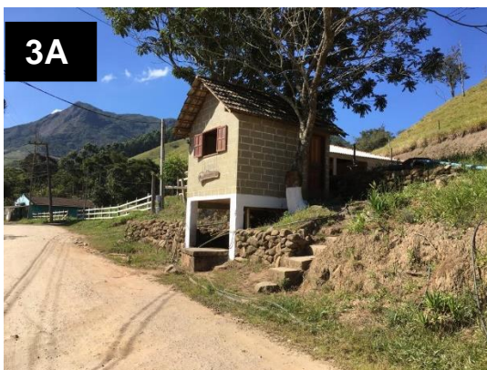
Figura 3A (esquerda) – construção que abriga a roda de água. Figura 3B (direita) – moinho de fubá acoplada à roda de água.

Foi observado ainda que uma das propriedades, além de praticar a olericultura, também possuía um restaurante com fogão a lenha (prática de atividade relacionada com turismo rural) e tinha uma roda de água para produção de fubá (Figuras 3A e 3B).