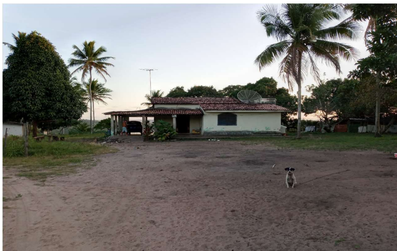
Figura 1: Vista da Sede da propriedade estudada

Foram utilizados como métodos a pesquisa: pesquisa bibliográfica, a pesquisa qualitativa exploratória (entrevista) e visita técnica no local. Os dados foram tabulados, analisados e são apresentados a seguir.