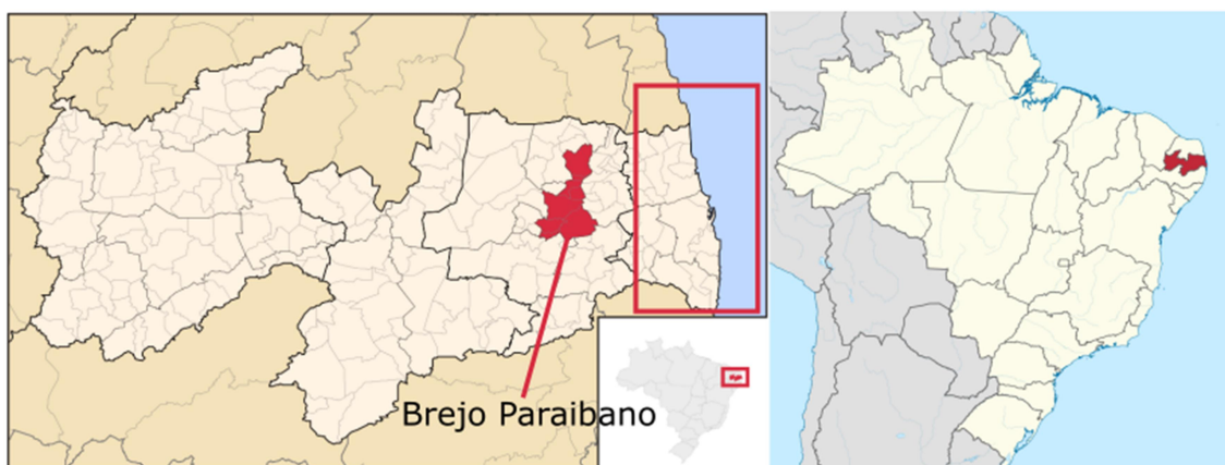
Figura 2 – Área estudada no estado da Paraíba. Nela está indicada o litoral e a região do Brejo Paraibano.