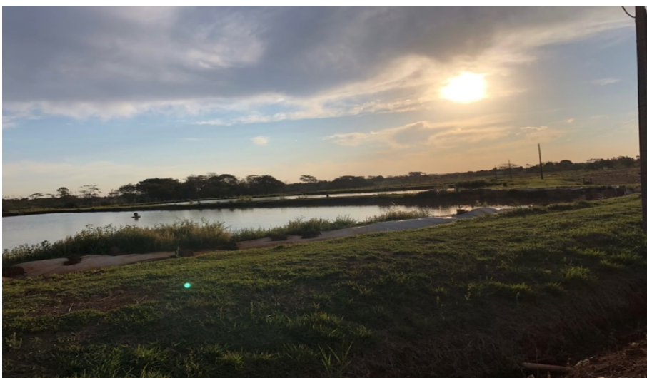
Figura 4 a (acima) e 4b (abaixo) – Piscicultura praticada em propriedade rural no Mato Grosso do Sul.