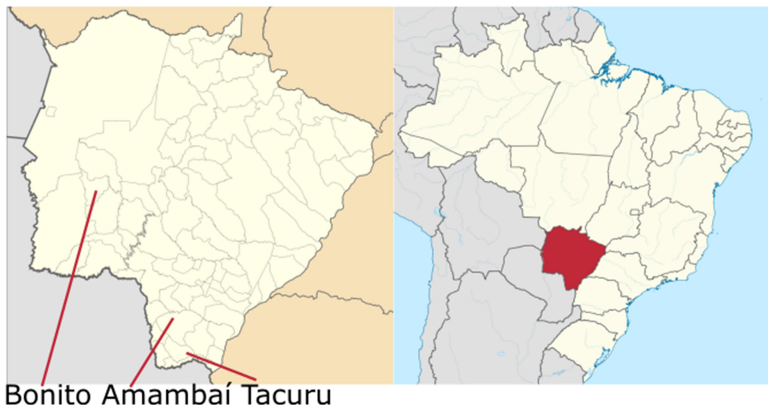
Figura 1 – Área estudada no estado do Mato Grosso do Sul.

-Solo (uso, presença de áreas erodidas, presença de áreas protegidas, manutenção e preservação).