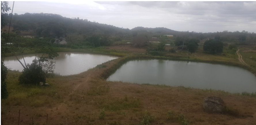
Figura 3 a (acima), 3b, 3c, 3d, 3e (abaixo) - Vistas de uma propriedade de piscicultura no estado da Paraíba.