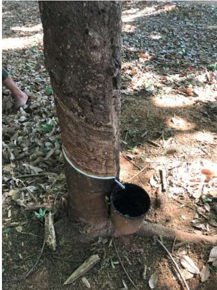
Figura 9: Extração de látex de seringueira da área recuperada.