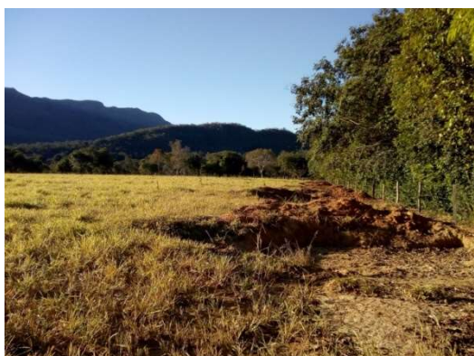
Figura 16: aspectos do procedimento de manutenção da qualidade do solo na região de Cavalcante com o uso de barreiras. Observar que estas barreiras também são importantes para retenção de água, além da presença de capim Mombaça no pasto.

Foram construídas cinco pequenas barragens do lado leste e três do lado oeste. As figuras a seguir mostram fotos da área com as barragens.