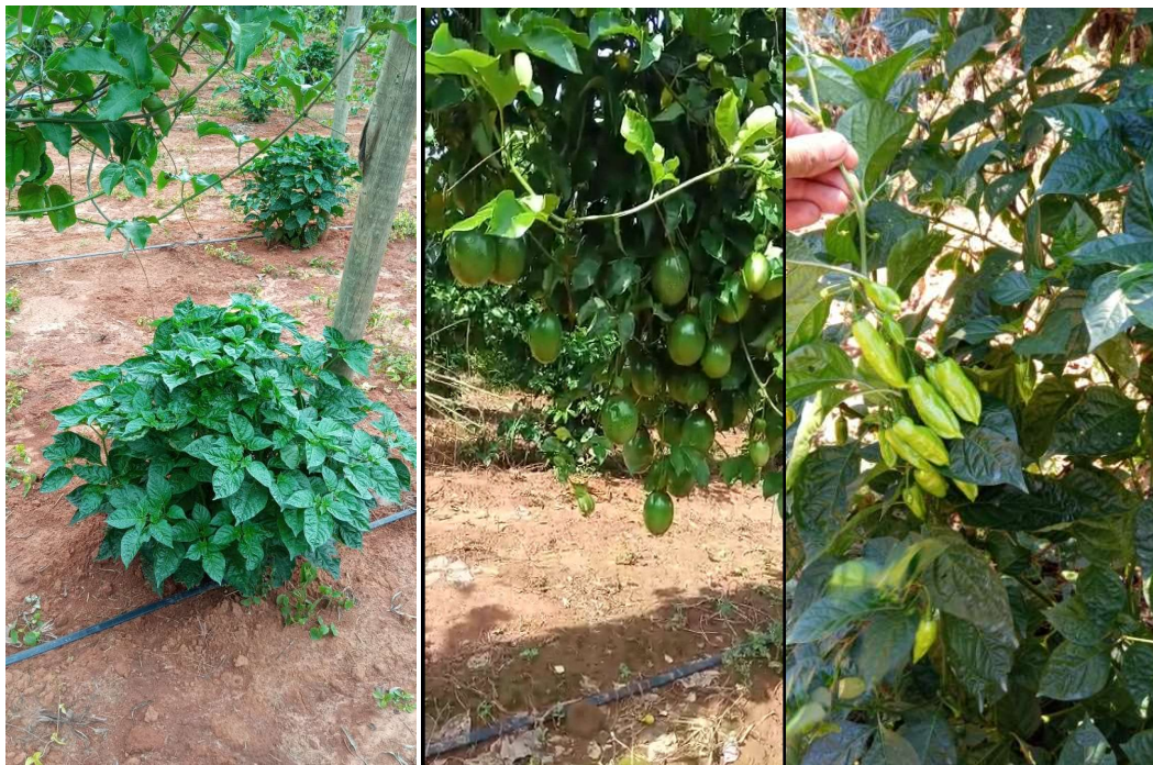
Figura 7: Detalhe do consórcio de cultura na região com a irrigação por gotejamento, mostrando pimenta (esquerda e direita) e maracujá (centro).