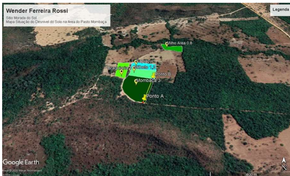
Figura 15B: A área da Fazenda Morada do Sol, em perspectiva diferente.