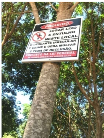
Figura 17: Sinalização levantada junto a área recuperada (seringal) para evitar o uso da área para descarte de resíduos.