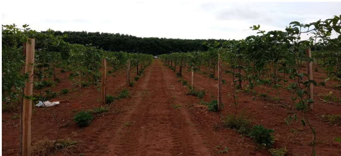
Figura 6: Plantação consorciada com maracujá, pimenta e abóbora nas áreas entre os seringais.

Nos primeiros quatro anos de cultivo foram adotadas práticas de manejo conservacionista e sustentável até a sua formação, através da implantação de um sistema de consorciação de culturas (plantação de diferentes espécies de próximas umas das outras) com maracujá ( Passiflora edulis ), abóbora cabotia ( Cucurbita moschata ) e pimenta de cheiro ( Capsicum chinense ) que possibilitou uma redução de custo com fertilizantes, insumos, irrigação e um total aproveitamento do solo nas entrelinhas das arvores (Figuras 6 e 7).