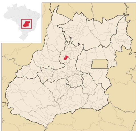
Figura 1: Mapa de localização de Carmo do Rio Verde.