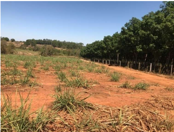
Figura 11: Área do seringal adjacente a uma área de plantação de cana-de-açúcar com solo exposto.