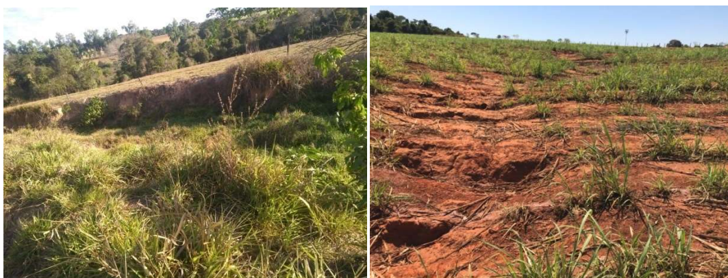
Figura 2 (esquerda). Erosão provocada pelo escoamento da água da chuva semelhante a área que foi posteriormente recuperada. Figura 3 (direita): princípio de erosão em campo de cultivo de cana-de-açúcar

pastagem observando-se também a redução de animais no local, já que estes iam até a nascente frequentemente buscar o que beber.