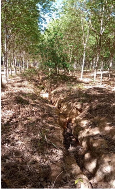
Figura 10: Erosão controlada na propriedade após o plantio de seringueira, onde foi possível observar com o passar dos anos que a erosão formada foi contida pelas raízes das arvores através da fixação do solo.