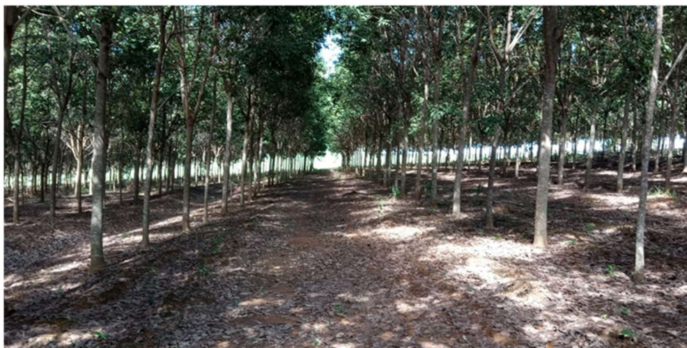
Figura 8: Visão geral da agrofloresta de seringueiras, seis anos após o cultivo

Cerca de sete anos após o início do cultivo de seringueiras (2020), já é possível observar no local a formação da agrofloresta com árvores de características uniformes (Figuras 5A, 5B e 8) e com potencial para extração do látex pois atendem os parâmetros necessário. Pelo menos 200 plantas apresentaram perímetro igual ou superior a 45 cm, à altura de 1,30 do solo como sugere Brito e Vieira (2018) para a extração do látex (Figura 9).