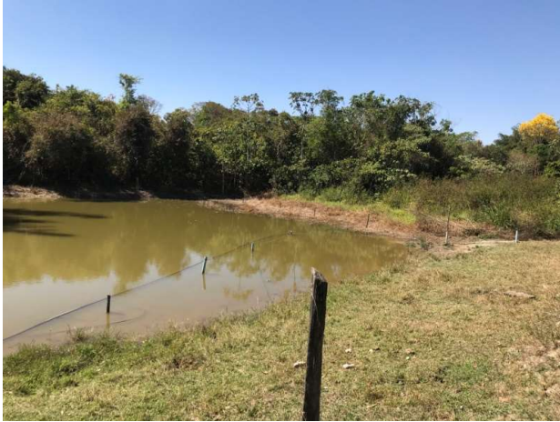
Figura 13: Vegetação da área de nascente e visão parcial do açude feito com o represamento das águas da nascente.